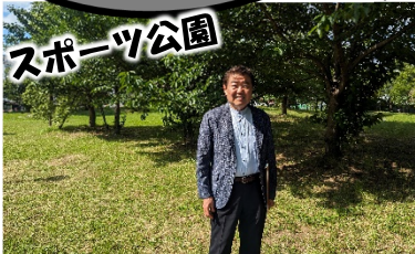
みなとの森公園整備「神戸」