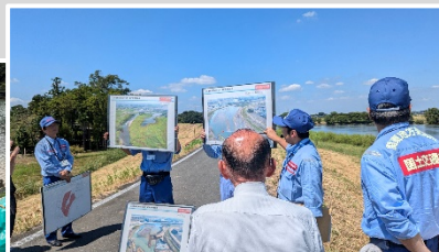
入間川流域治水工事