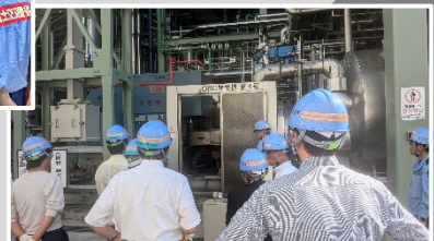
新河岸水再生センター