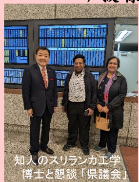
知人のスリランカ工学博士と懇談「県議会」