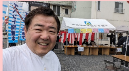
夏のふれあい感謝祭