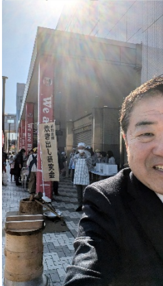
「美園駅東口」※自撮り(顔半分)～こんな事も

●県土都市整備委員会 県内視察 社会・家族の生活が個(弧)になった昨今。集団に縛られない個の生活スタイルは、楽で当然のように感じられる。