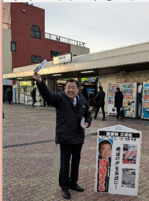
東浦和駅前のまーちゃん

●広報紙 地域通信/冬号 とっても寒い朝、東浦和駅前に立った。配布広報紙は、地域通信「冬号VOL. 246」。改札へ向かう多くの皆様からお声を頂き