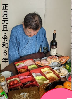
正月元旦・令和6年