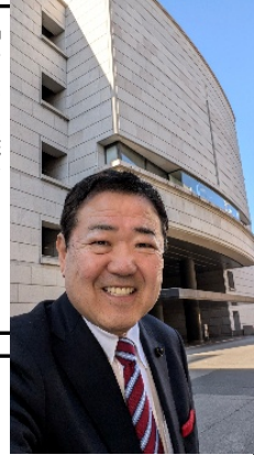
「埼玉県議会の玄関前」

「自撮り上手でしょう？」ブログやチラシ用、長いこと自撮りを続けている。スマホでの自撮りが、だいぶ慣れてきたと思う。 昨日から定例県議会が始まった。初日から物騒な爆弾騒ぎがあったが無事に済んだ。今日も、まーちゃんは元気に議会へ登庁した。議員の意見情報交換などを精力的にこなした。…そうして、議会2日目終了となる！