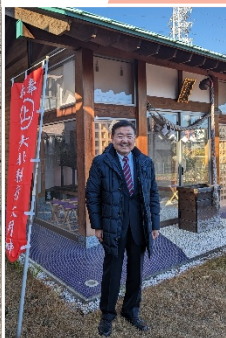
初詣「大北神社・令和6年」 ※まーちゃん設計作品