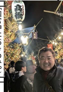
「調宮神社(つぎのみや)」

浦和の西の市へは、子供の時から通っている。この12月12日が県議会開会中という事から、議会終了後に調宮神社へ行く事にしている。今週木曜日にも夜に参詣したのだ。今年も、例年通りのたくさんのお出でであった。だが、期待していた知人との出会いは少なかった。なぜかな？時間かな？年齢かな？何かな？良ーく考えてみることにする。 …12日町へ行かないと、落ち着かない！